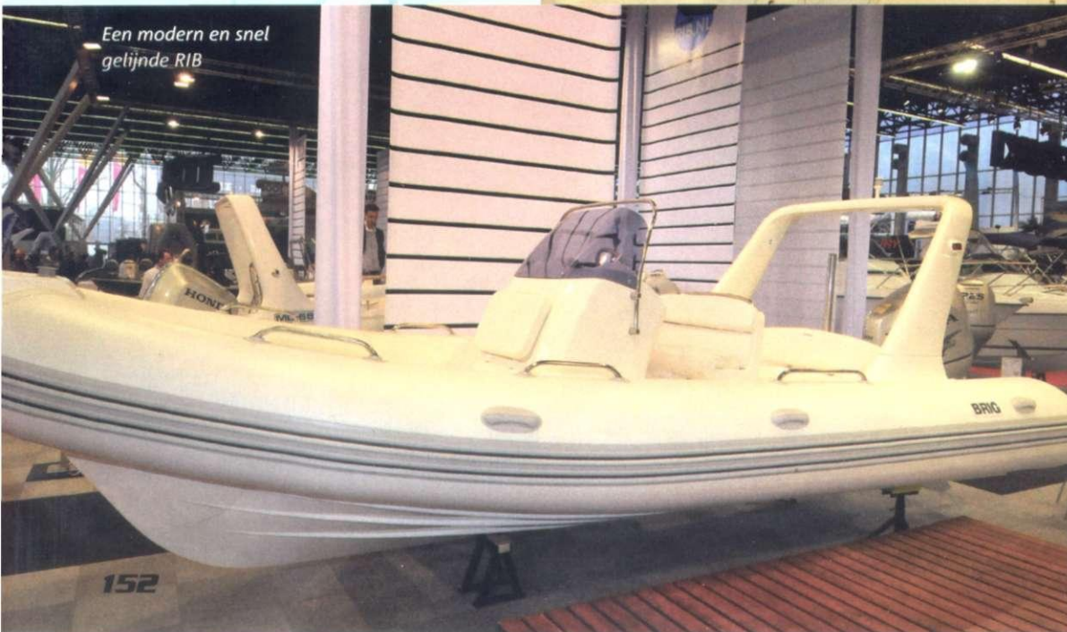
Een modern en snel gelijnde RIB