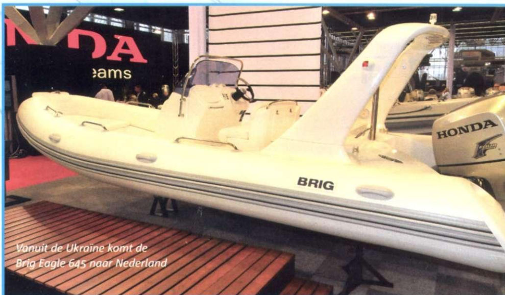
Vanuit de Ukraine komt de Brig Eagle 645 naar Nederland

Rubberboot Benelux Telefoon: 020-4536262